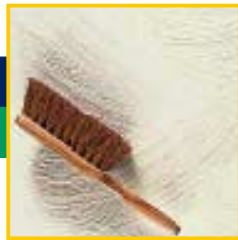
Balai ou spalter